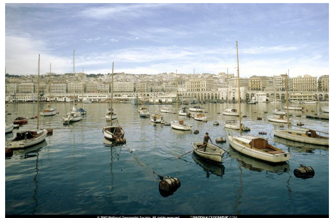
Hoofdstad Algiers, gezien vanaf de haven