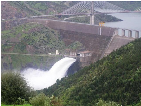
Beni-haroun stuwdam, de grootste dam in Algerije

Tot slot is van belang dat deze missie ook op een historisch moment plaatsvindt: in 2010 wordt het jubileum gevierd van 400 jaar betrekkingen tussen Nederland en Algerije!